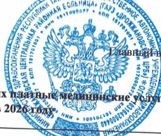
График работы медицинских работников, оказывающих платные медицинские услуги по ГАУЗ "Дрожжановская ЦРБ" в 2026 году